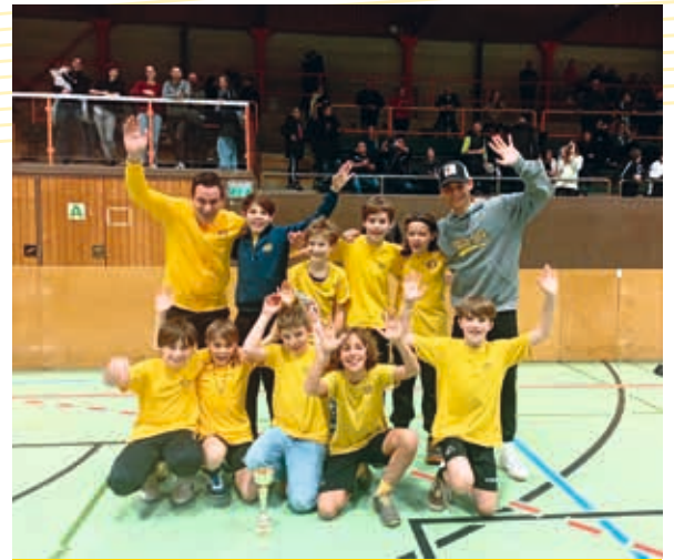
Generali Cup Innsbruck: 7. Platz U11