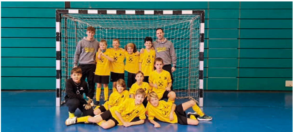
Nikolausturnier: U10 3. Platz