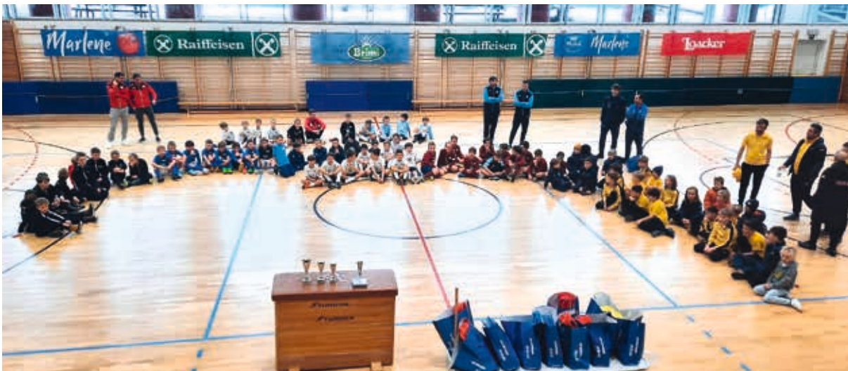
Vahr:n Drei-Königs-Turnier U9 Blau und U9 grün – Platz 4 blau und Platz 5 grün