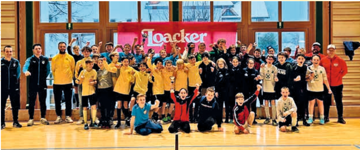
C-Jugend Turnier Lüsen – Drei-Königs-Turnier – 5. und 6. Platz