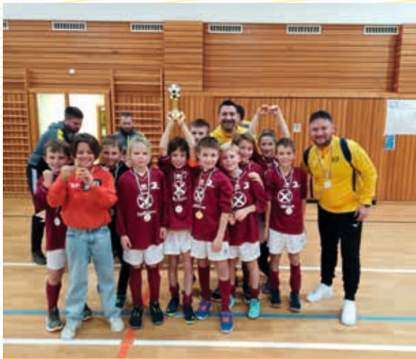
Ridnaun: U9 Gelb 2. Platz